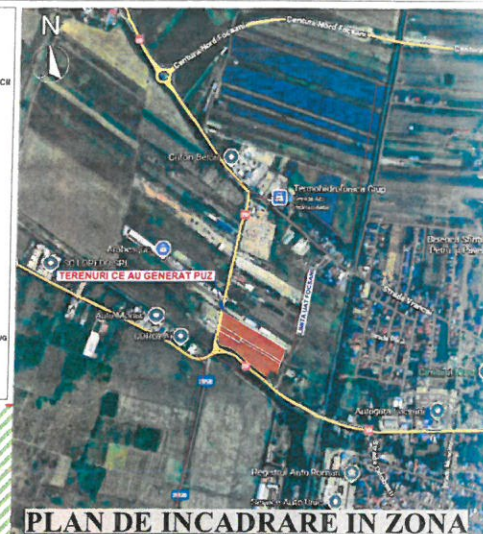
PLAN DE INCADRARE IN ZONA